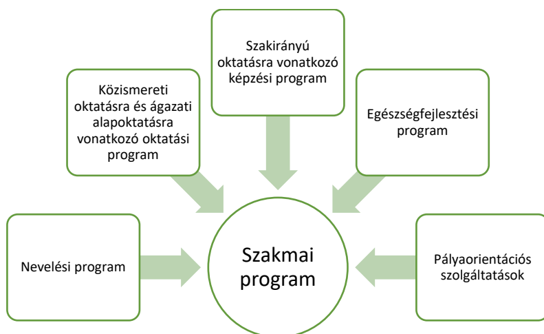
1 sz. ábra

Az Szkt. 12. §-a alapján a szakképző intézményben a nevelő és oktató munka a képzési és kimeneti követelményekre (a továbbiakban: KKK) figyelemmel kidolgozott szakmai program alapján folyik. A dokumentum tartalmazza a kötelező és az egyéb foglalkozásokat is. Része a nevelési program, a közismereti oktatásra és ágazati alapoktatásra vonatkozó oktatási program, a szakirányú oktatásra vonatkozó képzési program , az egészségfejlesztési program és a pályaaorientációs szolgáltatások (1. sz. ábra). Ez azt jelenti, hogy a szakképző intézmény mint a szakirányú oktatás megszervezője rendelkezik a szakirányú oktatásra vonatkozó képzési programmal, amely a szakmai program egyik eleme.