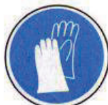
Védőkesztyű használata kötelező