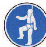
Testheveder használata kötelező