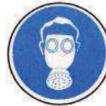
Légzésvédő használata kötelező