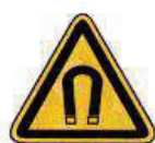
Erős mágneses tér