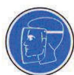
Arcvédő használata kötelező