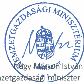
Nagy Márton István nemzetgazdasági miniszter