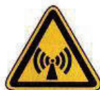
Nem ionizáló sugárzás