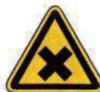
Ártalmas vagy ingerlő anyag