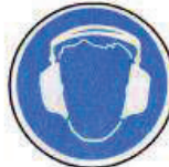
Hallásvédő használata kötelező