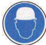
Fejvédő használata kötelező