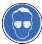
Védő-szemüveg használata kötelező