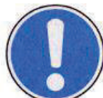
Általános utasítás (kiegészítő jelzéssel)