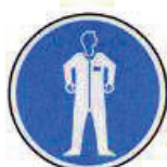
Védőruha használata kötelező