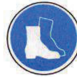
Lábvédő használata kötelező